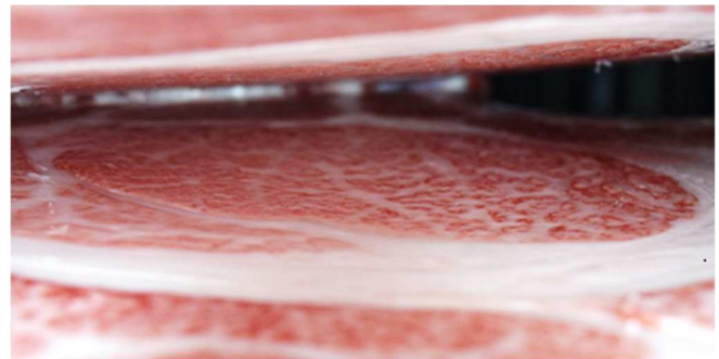
図2 枝肉 (表1のNo.1)