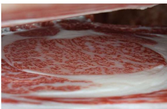
写真2 枝肉(表のメス No. 14)