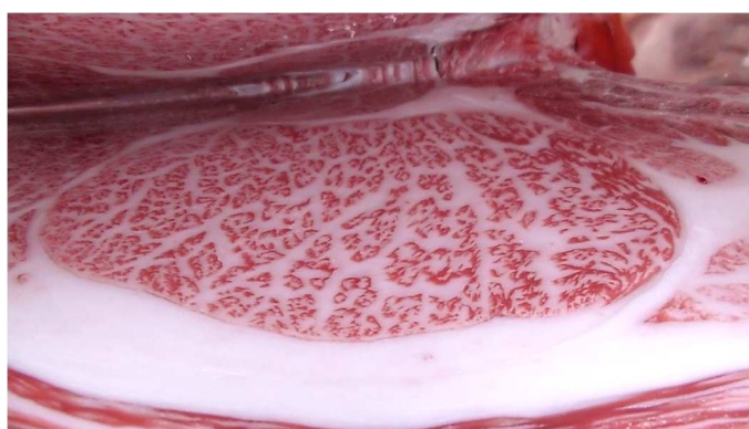
図2 枝肉 (表1のNo.5)