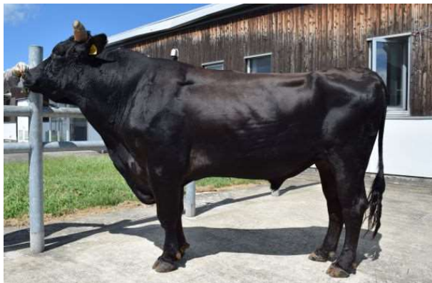
写真1 「冬景 2 1」